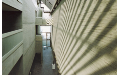
„Museumsstrasse“, Sprengel Museum Hannover (Ausschnitt)

Veranstaltungsort: Sprengel Museum, Kurt Schwitters Platz, Hannover