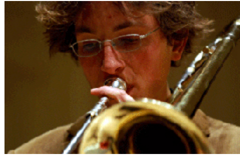
Johannes Lauer

Veranstaltungsort: Foyer des Nikolaissaals, Wilhelm-Staab-Straße 10-11, Potsdam