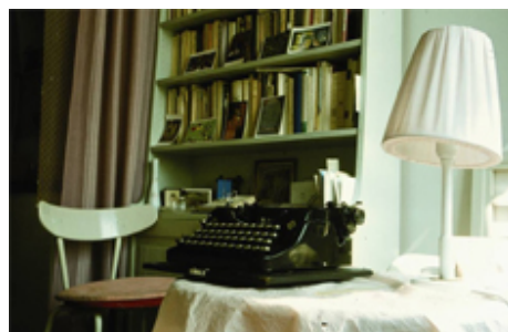
Nelly Sachs' Kajüte in Stockholm

Im Mai 1940 floh Nelly Sachs (Berlin 1891–1970 Stockholm) mit einem der letzten Flüge aus Berlin nach Stockholm. Vor ihr lagen dreißig Jahre Exil, die sie zeitweise in psychiatrischen Kliniken verbrachte, aber auch die späte Anerkennung als Schriftstellerin, unter anderem durch die Verleihung des Literaturnobelpreises 1966. Die Ausstellung "Flucht und Verwandlung" macht ihre Wohnung mit Blick auf die Gewässer Stockholms zum gestalterischen Mittelpunkt, von dem aus sich das Leben und Werk der Nelly Sachs anhand von unveröffentlichtem Material (Fotos, Manuskripte, Ton- und Bildaufnahmen, Krankenakte) in immer weiteren Kreisen erschließen lässt. Die Radikalität ihres Werkes soll ebenso sichtbar werden wie der sozialhistorische Kontext, in dem es entstand. Die Ausstellung wurde initiiert, kuratiert und gestaltet von Aris Fioretos und gewerk design. In Kooperation mit dem Jüdischen Museum Berlin, dem Jüdischen Theater Stockholm, der Königlichen Bibliothek Stockholm, der Schwedischen Botschaft und dem Suhrkamp Verlag.