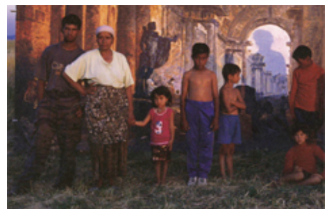
Ausschnitt aus Danica Dakic, La Grande Galerie, 2004

www.saechsischer-kunstverein.de www.hellerau.org