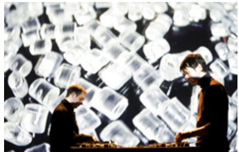
transmediale.09 Performance - Pe Lang + Zimoun, Untitled Sound Objects

„Futurity now!“ lautet das Thema der transmediale.10. Das 20. Jahrhundert hindurch stellten Schriftsteller und Vordenker das Jahr 2010 als das leuchtende Beispiel einer Zukunft dar, die von technischem Fortschritt und sozialer Harmonie geprägt sein würde. Aber je näher 2010 rückt, umso deutlicher wird, dass die Weltgesellschaft weder den Utopien noch Dystopien entspricht, die traditionellerweise in diesen Fiktionen, Architekturen und Theorien der Zukunft gezeichnet wurden. Stattdessen entstand ein zunehmend komplexes Netz aus wirtschaftlichen, politischen und kulturellen Systemen, die von der sich schnell entwickelnden und konvergierenden Medientechnologie abhängen. Digitale Praxis und soziale Medien sind ein wesentlicher Teil unseres Lebens und fest in unserem kulturellen Code verwurzelt. Unter dem Motto „Futurity now!“ untersucht das Festival, welche Rolle die Entwicklung des Internets, die globale Netzwerkpraxis, Open-Source-Methoden, nachhaltige Gestaltung und mobile Technologie bei der Bildung neuer kultureller, ideologischer und politischer Modelle spielt.