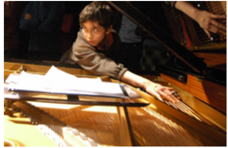
Workshop Vibrations

Die Biennale chiffren – Kieler Tage für Neue Musik ist eines von 15 Projekten, die im Rahmen des Netzwerk Neue Musik gefördert werden. Nach den Erfolgen von 2006 und 2008 präsentiert chiffren auch 2010 wieder eine Fülle an Konzerten und Veranstaltungen mit hochkarätigen Ensembles aus Schleswig-Holstein, Berlin und Wien. Höhepunkte sind das Eröffnungskonzert des ensemble reflexion K sowie das Konzert des Klangforums Wien, eines der weltweit führenden Ensembles für Neue Musik. Das Zusammenspiel von Instrumenten und Live-Elektronik, Video und Performance-Elementen steht im Mittelpunkt des Konzerts des Kammerensemble Neue Musik Berlin. Neben Werken von Luigi Nono und Gérard Grisey präsentiert das Ensemble Experimente mit Vogelstimmen, dem Verkehrskollaps in Buenos Aires oder dem Klicken von Fahrrad-Naben. Mit besonderen Vermittlungsprojekten wie „Crescendo“, „Tuchföhlung“ und „Vibrations“ stimmt chiffren vorab auf die Entdeckungsreisen in ungewohnte Klangwelten ein.