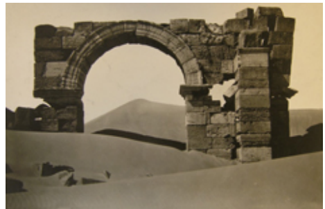
Trajansbogen in Timgad, um 1925

Welche Impulse standen hinter der intensiven wissenschaftlichen Auseinandersetzung mit antiken Kulturen im 19. Jahrhundert? Wer waren die Pioniere, die archäologische Stätten ausgruben, und welche Interessen leiteten ihre Auftrag- und Geldgeber? Diese Fragen wurden gemeinsam mit internationalen Partnern in einem umfassenden historischen Kontext untersucht. Die Ausstellung zeigt, wie sehr die europäischen Expeditionen in den Nahen Osten, nach Zentralasien oder Afrika politisch motiviert waren und archäologische Ausgrabungen für die Kolonialpolitik instrumentalisiert wurden. Sie präsentiert über 800 bedeutende archäologische Funde und zeichnet die Lebensgeschichten von Personen wie Lawrence of Arabia, Gertrude Beil oder Carl Humann nach. So ergibt sich für den Besucher eine zusätzliche Perspektive auf die Kolonialgeschichte verschiedener Länder. Die vergleichende und globale Fragestellung der Ausstellung bildet ein Novum in der archäologischen Forschung. Auch die Fundgeschichte archäologischer Sammlungen ist angesichts von Rückgabeforderungen in vielen europäischen Ländern ein höchst aktuelles Thema.