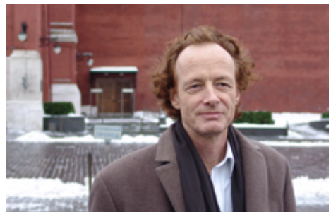
Beat Furrer

Veranstaltungsort: MaerzMusik Festival, Schaubühne, Kurfürstendamm 153, Berlin