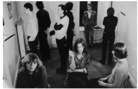
Filmstill aus „Demon“ 1976/77 von Heinz Emigholz

Veranstaltungsorte: Hamburger Bahnhof – Museum für Gegenwart, Invalidenstraße 50 (Ausstellung) und Kino Arsenal, Potsdamer Straße 2, Berlin (Panel Diskussion)